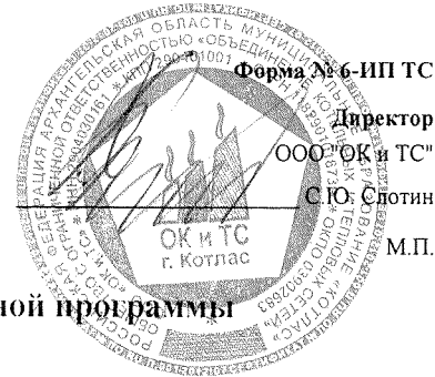
График реализации мероприятий инвестиционной программы ООО "ОК и ТС"